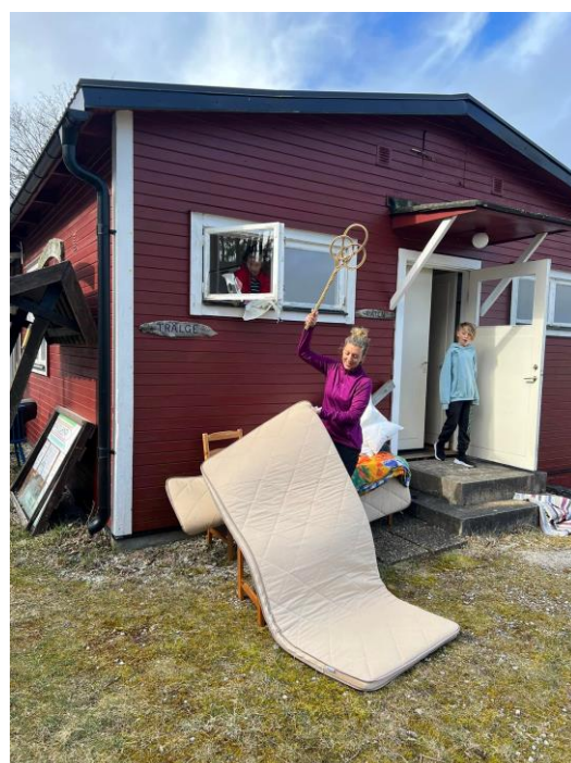
Städdagen slog nog nytt rekord i antalet medlemmar som kom och hjälpte till och gjorde stugor, lägenheter och omgivning riktigt fint.