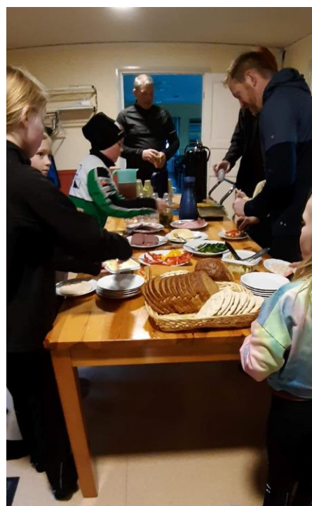
2022 – när vi äntligen fick sova på hårt underlag igen. Samlas och köra kart och vägvalssnack efter tävling och fika vid Kinner efter tisdagsträningarna.