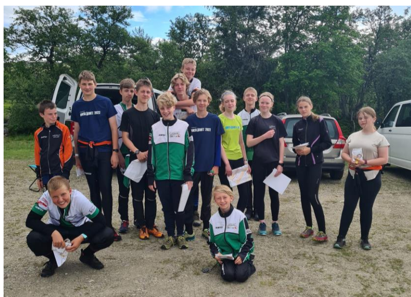
2022 var Rikslägret äntligen tillbaka och det var ett stort gäng från Gotland som deltog och äntligen fick åka på läger och samla på sig massor av erfarenhet. 10 deltagare från Bro OK