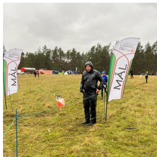
Helg utan älg genomfördes i storm och regn i Fleringe.