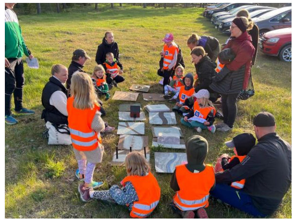
Wildkids och övrig ungdomsverksamhet har rullat på med nya och gamla ungdomar