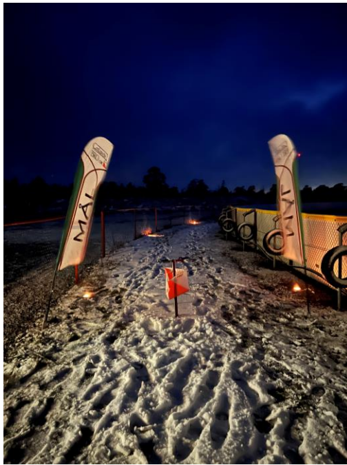
Nattinatta avgjordes i Hejdeby