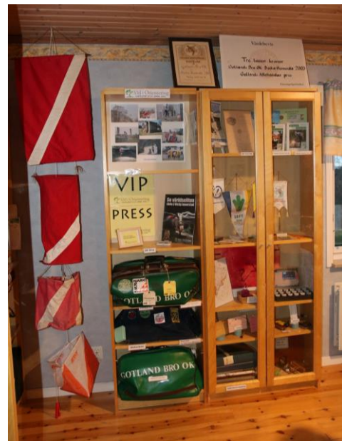
Vårt museum är invigt och fylls hela tiden på med mer saker.