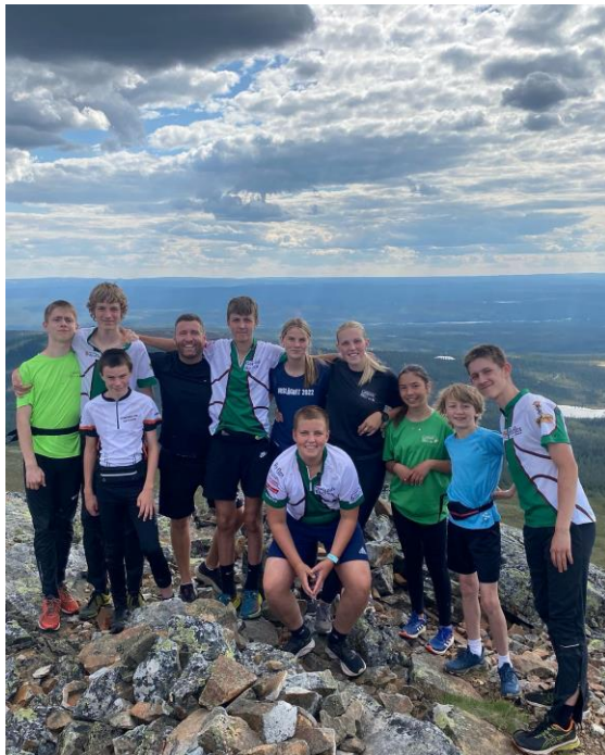
Riksläger och att bestiga Städjan – jobbigt, häftigt och superkul.