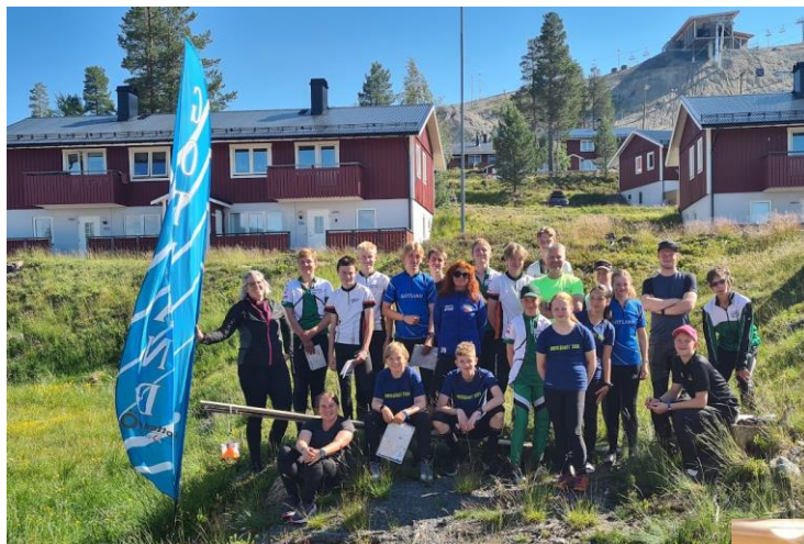
Riksläger i Idre – ett givet och uppskattat läger för ungdomarna!